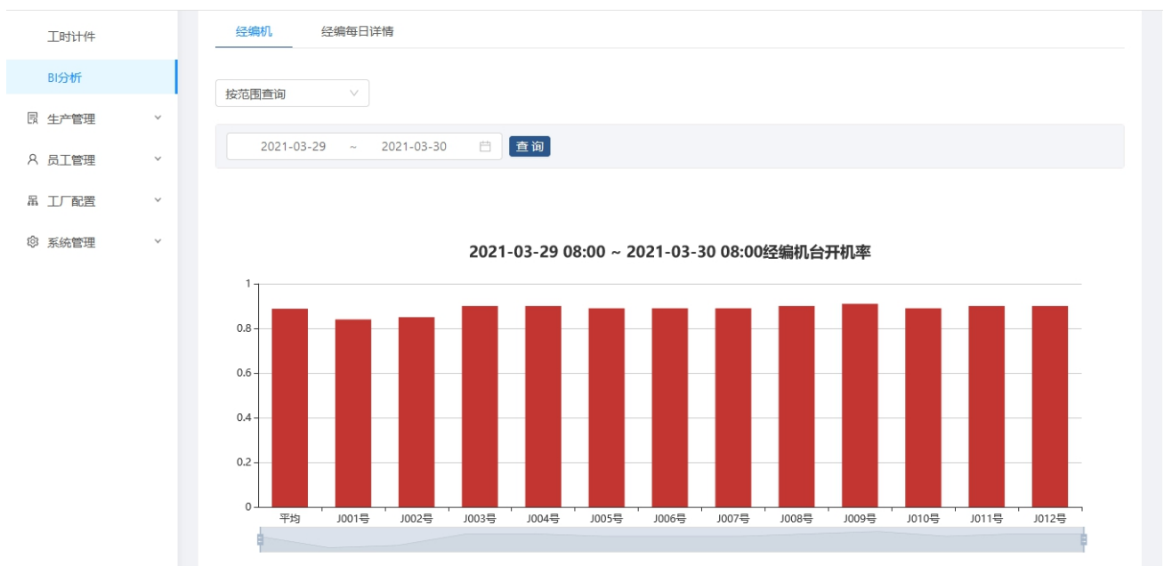
图 2 BI 分析